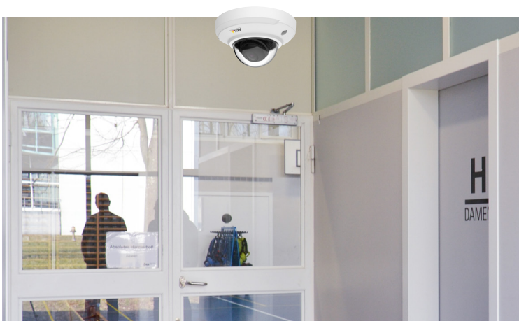
le gymnase, les entrées des vestiaires, les salles informatiques, pour la sécurité de tous.