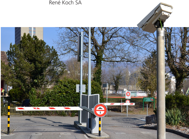
L'accès, la caisse du parking et d'autres zones extérieures sont comprises, de même que