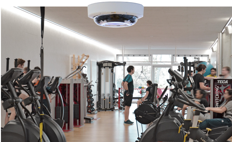
Des caméras multi-objectifs permettent de voir dans le centre de fitness ou dans le foyer.